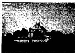
Klasztor pobernadyński w Ostrołęce.