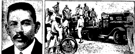
Od góry na lewo: uzbrojeni cywile wyruszają do walki przeciwko powstańcom. Na prawo: Prezydent Hondurasu Collindres. Od dołu na lewo: generał Gregorio Ferrera, przywódca powstańców. Na prawo: Marynarze amerykańscy z karabinami maszynowymi lądują w Nicaraguę aby w krytycznym momencie stanąć w obronie amerykańskich obywateli.