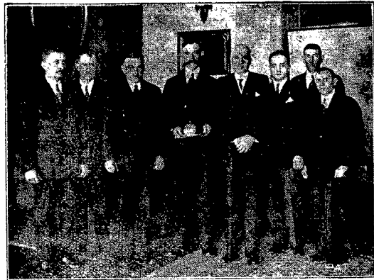
Dar kaszubów dla Pana Prezydenta Rzeczypospolitej Polskiej

Dzieli staraniem władz harcerskich uzyskano dla uczestników wyprawy znaczne ulgi, tak, że całkowity koszt 14-dniowy pobytu wyniesie niepełna 100 zł. od uczestnika.