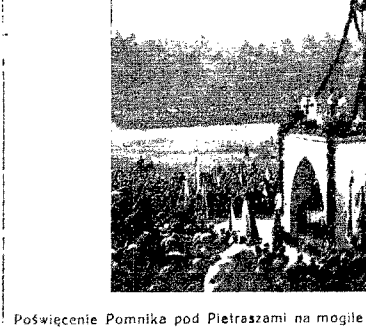
Powieszenie Pomnika pod Pietraszami na mogile 16-tych obywateli zamordowanych przez bolszewików.