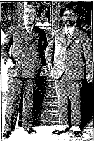
Dr. Eckener (na lewo) odwiedził francuskiego ministra lotnictwa Dumesnila. Przepuszczają, że tematem rozmowy była sprawa uzyskania lotniska dla zepelina w okolicy Paryża.