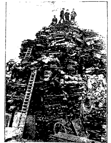
Sieruska Europa w szybkim tempie amerykańni- zuje się, a tryb swego życia nagina do kanonów i wymogów amerykań. Do niezwykłych dla Europy zjawisk należy olbrzymie cmentarzysko starych samochodów w Holandji