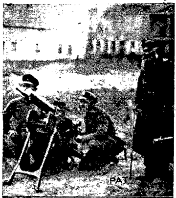
Partyzant i przywódcę do ziemi na której się żyje przemogły w starym izraelickim łęku i kazali mu czuć przy powstańczym karabinie maszynowym