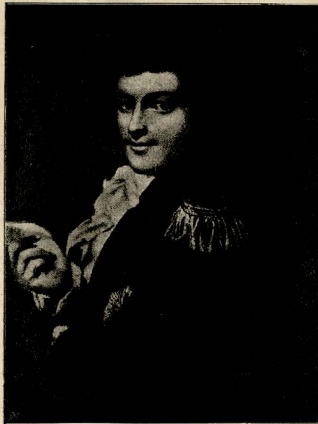
Michał Kleofas Ogiński, ostatni podskarbi wielki litewski. (według współczesnego portretu).

obmywać podrażnioną skórę octem dystylowanym. Zdaje się, że ta rada przypadła Napoleonowi do gustu, przynajmniej nie wspominał więcej o swem niedomaganiu,