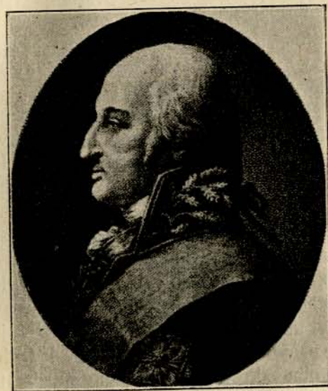
Tadeusz hr. Czacki.

Tymczasem nadjechał ks. Czartoryski. Był to już koniec roku szkolnego, t. j. czas najniefortunniej wybrany dla wizytacji Uniwersytetu.