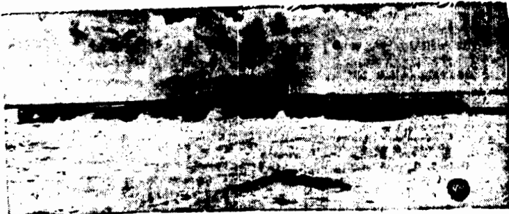
Wcielony do Marynarki Wojennej