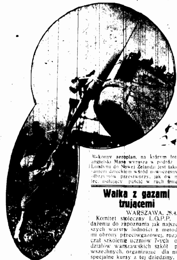
36-koński aeroplan, na którym lotnik angielski Mase wyrusza w podróż z Londynu do Nowej Zelandii jest takim samem dzieckiem wśród nowoczesnych samolotów, jak ów mały, usiłujący puścić w ruch śmigło.