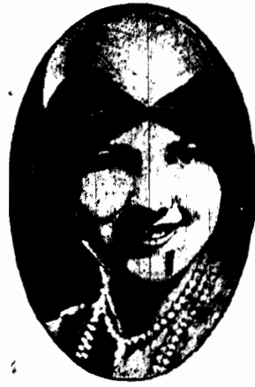
Kapelusik z jasnej słomki bangkok z odwiniętym i wyciętym z przodu brzegiem, ozdobionym kolorową aplikacją.