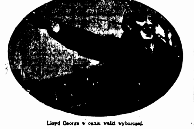
Lloyd George w ogniu walki wyborczej.