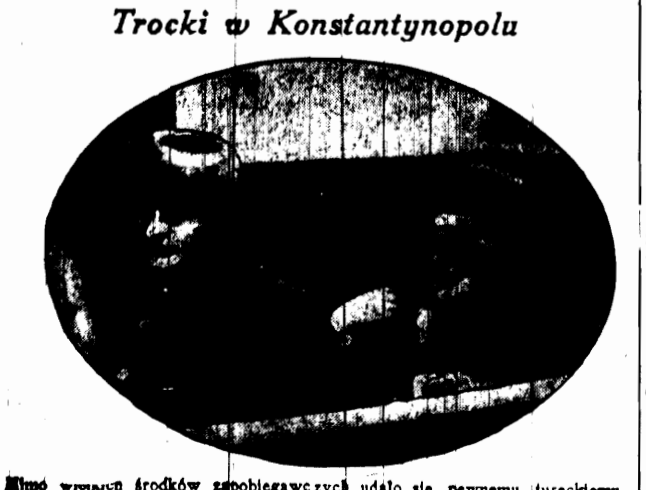
Wielki wyrostek środkowy zapobiegawczy udało się pewnemu (tureckiemu) fotografowi, przebranemu za szofera, zdjąć ex-dyktatora czerwonej Rosji — Trockiego wraz z jego małżonką w chwili, gdy udają się oni z hotelu do świętej wynajętego mieszkania.

Trocki odwiedził Konstantynopol i spotkał się z wieloma przedstawicielami polskiej emigracji. W czasie wizyty wygłosił wiele interesujących przemówień. Wobec tego, że w Warszawie jego przyjazd jest nie do zaakceptowania, w Konstantynopolu spotkał się z wieloma przedstawicielami polskiej emigracji. W czasie wizyty wygłosił wiele interesujących przemówień.