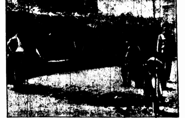
Meksykański samolot bojowy pod Jimines w pogotowiu wojennym ukryty przed wzrokiem lotników wojsk powstańczych zastanawiających się o jego przebiegu.