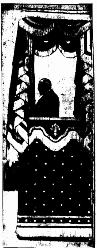
Premier francuski p. Raymond Poincaré wygłasza przemówienie nad trumną zmarłego marszałka.