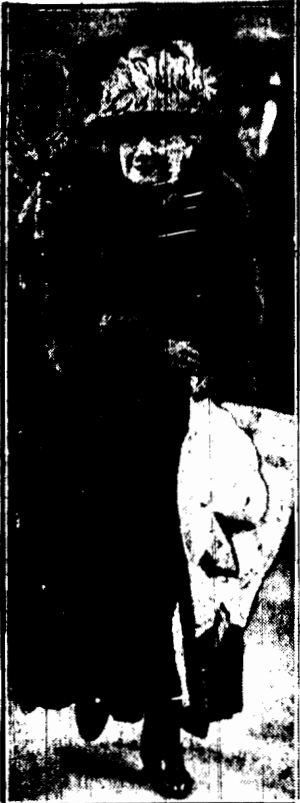
Wdowa po zmarłym marszałku Focha, krocząca w orszaku żałobnym za trumną męża.