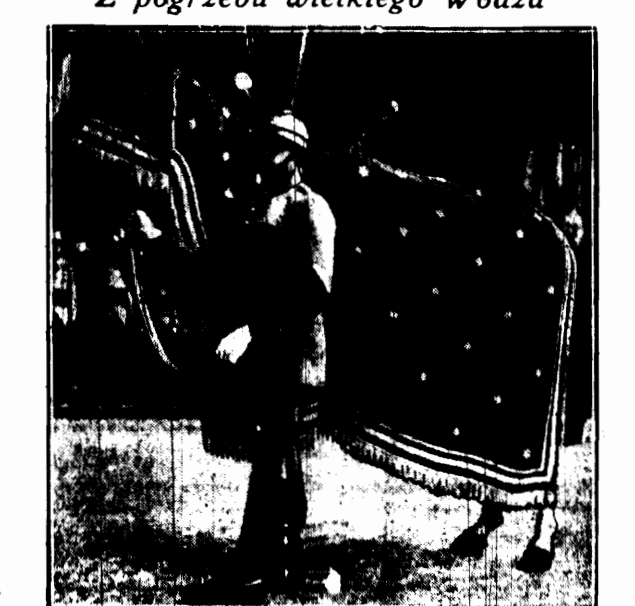
Za trumną zmarłego marszałka Focha prowadzono okrytego krepą konia.