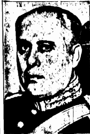
Główny dowódca powstańców meksykańskich wzięty do niewoli i rozstrzelany przez rząd Porfirio Gila.