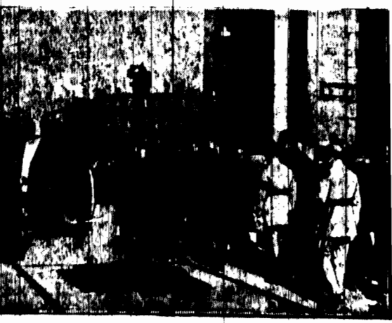
Trumna ze zwłokami wielkiego wodza złożona na lawecie kramarnej zbiera się do Łuku Triumfalnego, przy którym oczekują jej marszałkowie Foch, córki i najbliższa rodzina.