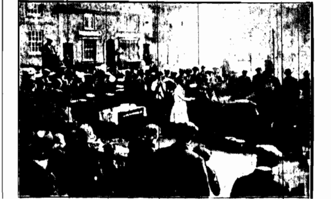
Począwszy od dziesiątego wieku w małym miasteczku angielskim Thame na rynku w dn. 23 marca jest pieczenie na rożnie wół, a ludność czeka czerwiec piwne, aż burmistrz rozdzieli porcję.