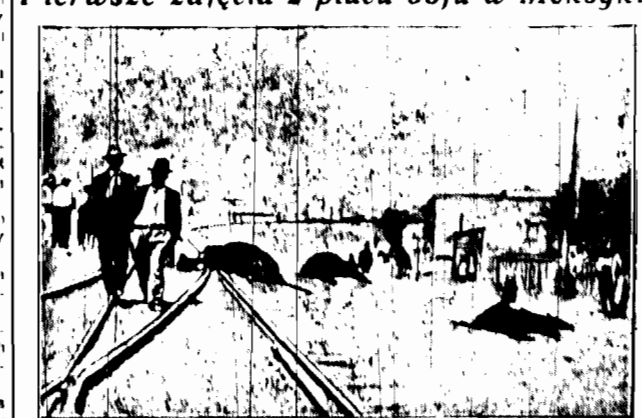
Ulica w Juarez, po zdobyciu miasta przez wojska rewolucyjne. Tupy kule, które świadczy o zwycięstwie, która sta niedawno toczyła.