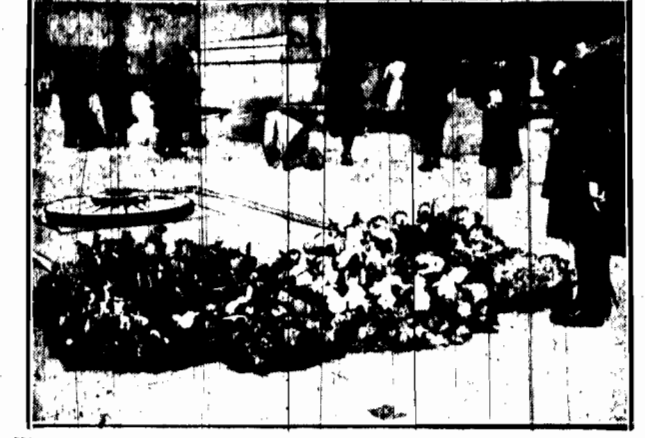
Wdowa po marszałku Fochu złożyła na grobie Nieznanego Żołnierza trzy wieńce od trzech monarchów, którzy nie znali ostatniego życzenia zmarłego bohatera, by tego trójcę niezdobyły żadne kwiaty.