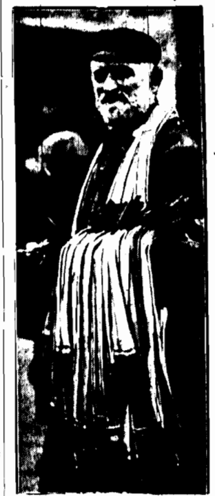
demontuje amatorom sprzecuwu w Halach w Warszawie.