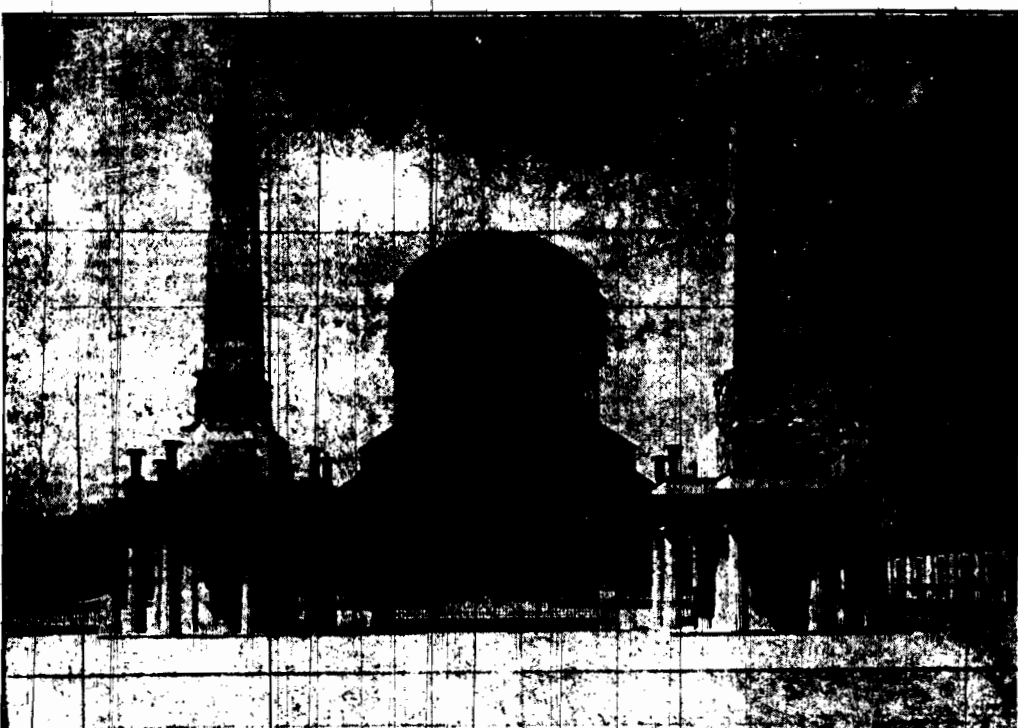
Wjeżdża na P. W. K. na tle wieży górnośląskiej, w której pomieszczone będą eksponaty przemysłu metalowego.

BEZPŁATNY DODATEK ILUSTROWANY poświęcony Powszechnej Wystawie Krajowej w Poznaniu