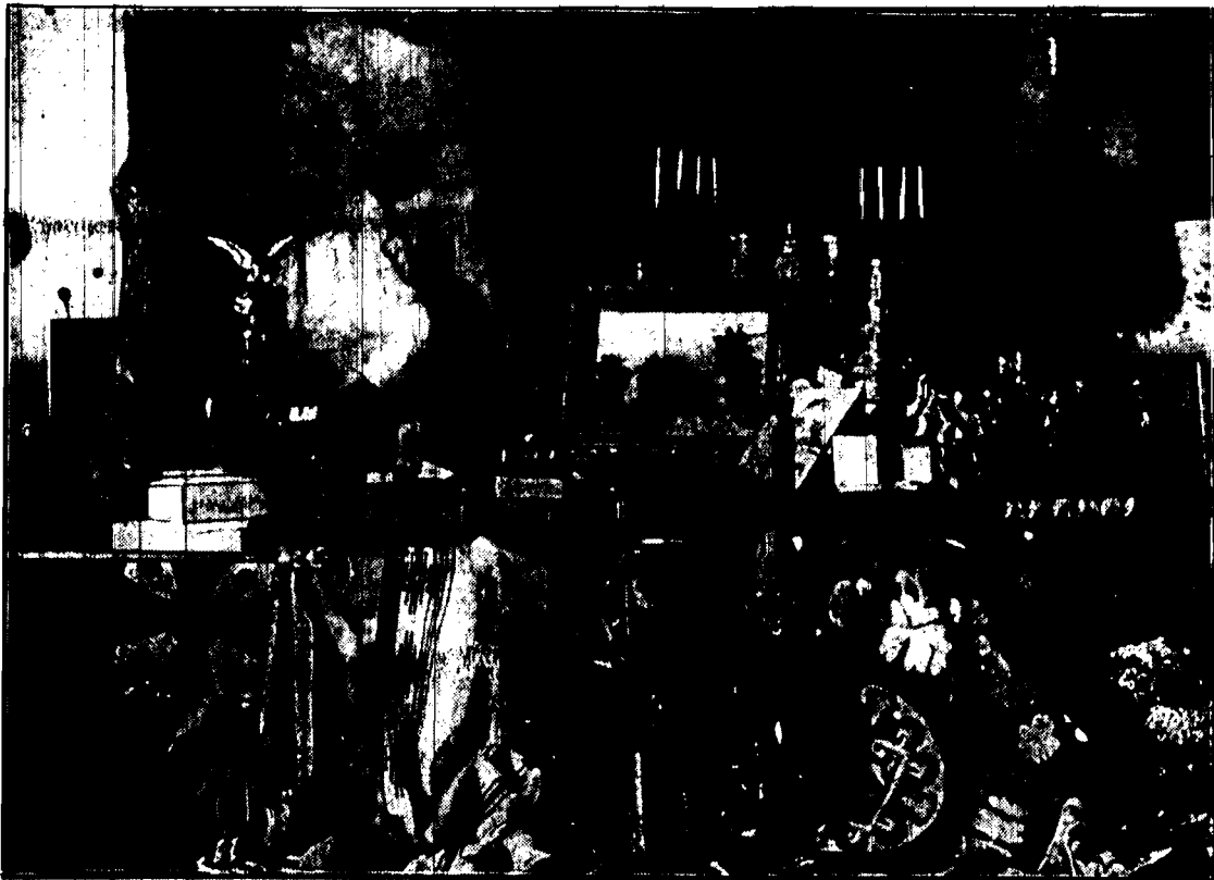
Jak i co roku, Marszałek Piłsudski otrzymał w dniu imienin szereg prezentów i darów ze wszystkich stron kraju od najrozmaitszych instytucji, osób prywatnych i wojskowości.