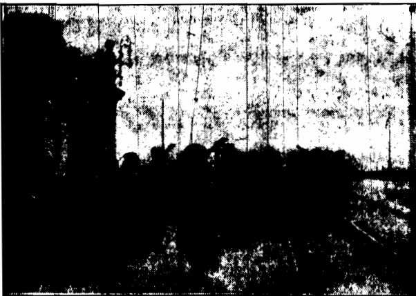
W marszu do Belwederu!