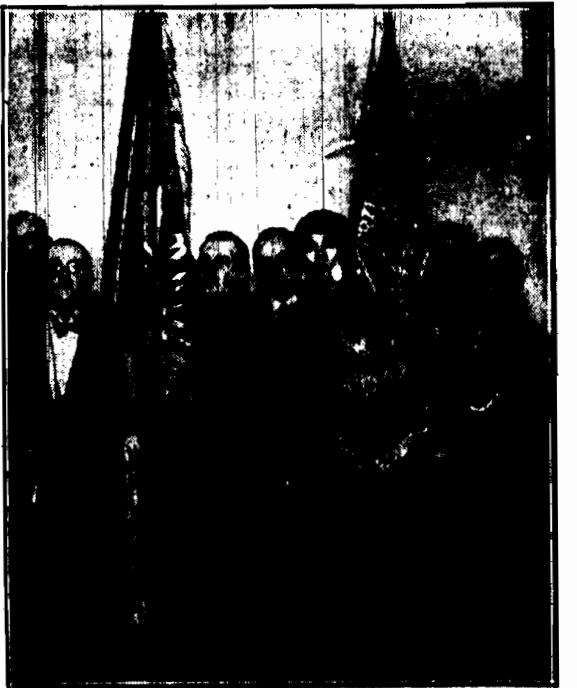
Sztandary Związku legionistów i Związku strzeleckiego asystują przy składaniu życzeń przez delegację pochodu obywatelskiego.