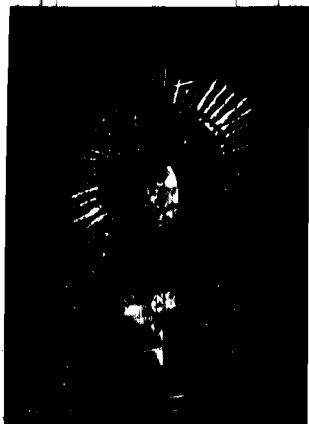
Małemu antytrytonowi z polskiego jedwabiu, ofiarowany Marzalskiemu Piłsudskiemu przez szkołę haftu przy Związku obywatelskiej pracy kobiet.