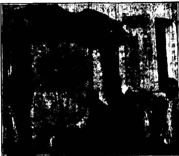
Obrzytny obraz, złożony w darze imiennowym przez delegację 4 gmin pogranicznych ze Śląska Cieszyńskiego.