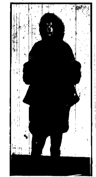
Kandydat do lotów podbiegowych, a jest już niedługo w rękach amerykańskich i angielskich. Amerykanek — skomponowały sobie ciężki koszyk i wyczołowały na gładkiej powierzchni wypawy polanej Byrdą

Następnie, uwolniony od więzów królewskiej, jako zwykły obywatel