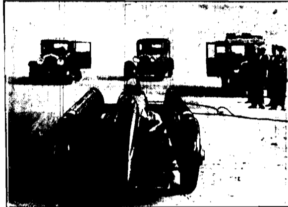
Samochód napier Napier, na którym znakomity kierowca angielski ustanowił na 13-tydzień nowy, fantastyczny rekord światowy szybkości — 370 km na godzinę.