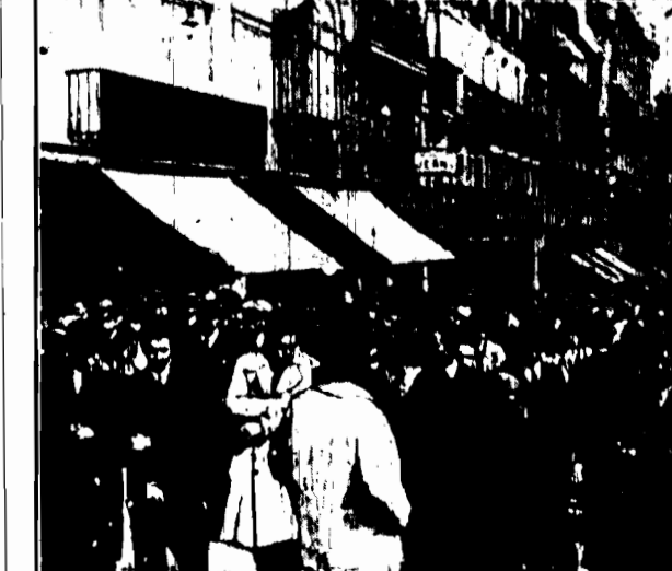
Jako jeden z licznych aktów protestu społeczeństwa hiszpańskiego przeciwko dyktaturze gen. Primo de Rivery studenci uniwersytetu madryckiego przystąpili do demonstracji, która polegała na podpaleniu i zniszczeniu w drodze