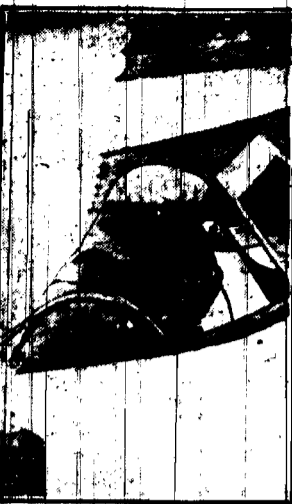
Francuski kotnik Lemoinne, który chce pobić rekord wysokości, osiągnął 11.000 metrów zbrojony w masę powietrzną i oddychał w rozszerzonej atmosferze tlenu.