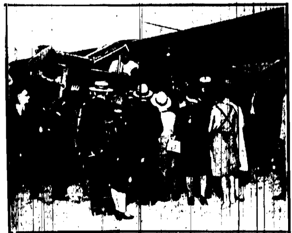
Samolot, na którym Charles Lindbergh odbył ze swą narzeczoną „spacer” — przedmiot oryżymu piorwznowy w swol karierze wypadkow, na chwilę przed odjazdem Lindbergh stał w oście lubiny.