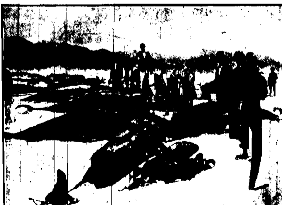
Oto jak wygląda wybitnie morskie po wielkim cyklonie, który przoszedł nad Ameryką Południową