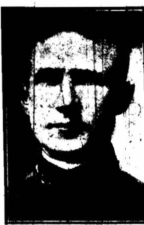
General armji amerykańskiej, który interwenjował w sprawie zawarcia porozumienia między powstańcami i wojskami rządowymi w Meksyku.