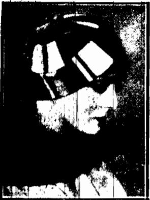
Kapelusze - berecik z gumowanej wstazki... (Caption describing the mask and its components)