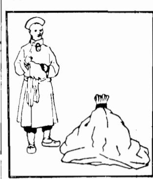
Fig. 3. Skuty Chińczyk, który wyszedł z zawieszanego i opieczetowanego worku.

Złotei zakawa się Chińczyk w obrozie i kajdanki... (Text about the escape attempt)