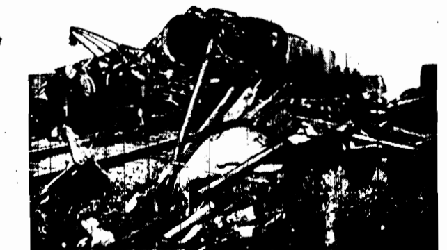
Podczas porażenia Berlin - Essen... (Caption describing the train accident and the fate of the cows)