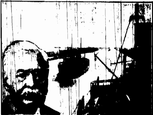
70 lat temu, 25 kwietnia Lesseps rozpoczęła budowę kanału od morza do morza...