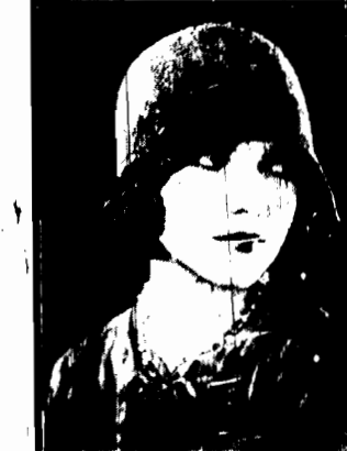
Cały świat myśli, że o końcu zimy, a przedewszystkiem wiosny, nie może być mowy. Oto plukany i woski model kapelusza na złotobrodzowego bankietu, obramowa- nego złotą siatką.