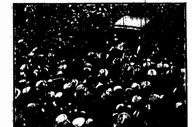
Następca tronu angielskiego ks. Walji zdecydował się na sprzedaż swej cennej stajni wyścigowej. Na placu licytacji zgromadziły się tłumy ludzi, którzy entuzjastycznie witali oszczędnego księcia. Na zdjęciu naszym wysiada on z samochodu.