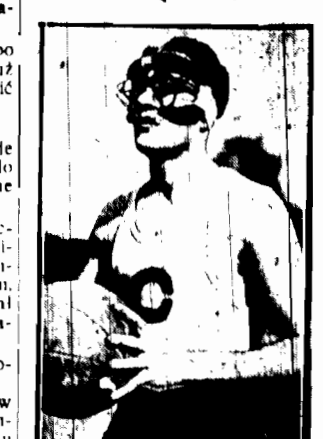
Najlepszy gracz Ameryki w koszyków- ce jest krótkowzrostem. Aby więc u- chronić okulary przed rozbitiem stosu- jąc je specjalną maszkę.