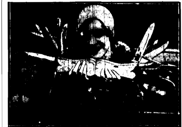
Na wystawie w Filadelfji sensację wzbudził olbrzymi scyzoryk, wa- żący 10 kg. Sto jego ostrzy służy do 1000 przeróżnych celów.