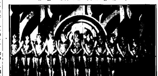
Występ artystyczny w czasie koncertu „Dni pro Quo” w sali koncertowej. W tle widoczny portret Polki z czasów powstania styczniowego.