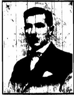
MIN. PRZEMYSŁU I HANDLU inż. E. KWIATKOWSKI

Znakomita nasza rodaczka, pani Maria Skłodowska - Curie przysłała godność członka honorowego Związku wynalazców.