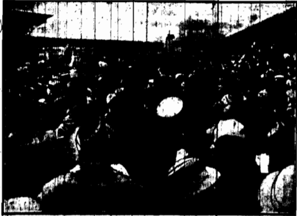
Powracającego po wspaniałych triumfach z Ameryki boksera Schmelinga w Berlinie oczekują tłumy. Na dworcu zebrały się wielotysięczne tłumy widzów, które przełamały kordon stu policjantów.