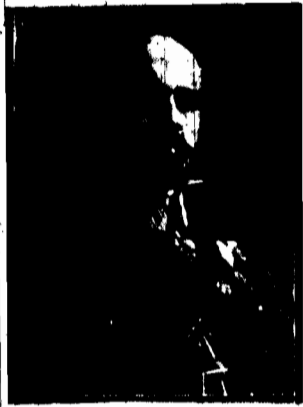
SENJOR POLSKICH WYNALAZCÓW GEN. LIPKOWSKI

Wstawił za granicę wiele polskiej liczącej licznym wynalazkom i pracom w dziedzinie mechaniki i metalurgii.