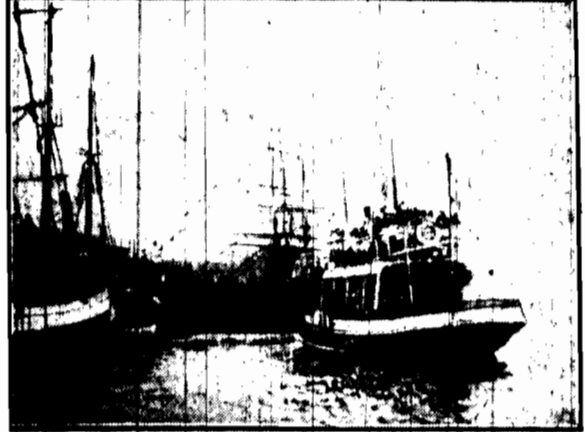
Rybacka flota francuska opuszcza port St. Malo, udając się w drogę do Nowej Ziemi. Coroczna ta wyprawa połączona jest z uroczystością „Rozgrzeszenia Nowej Ziemi”. Łowy te bowiem są połączone z wielkim nabożeństwem i wieli rybaków może już nie użyć brzoźów Bretanii.