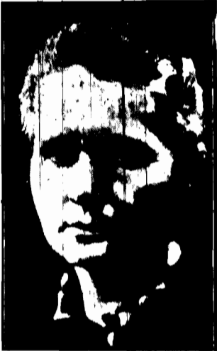
SKŁODOWSKA - CURIE