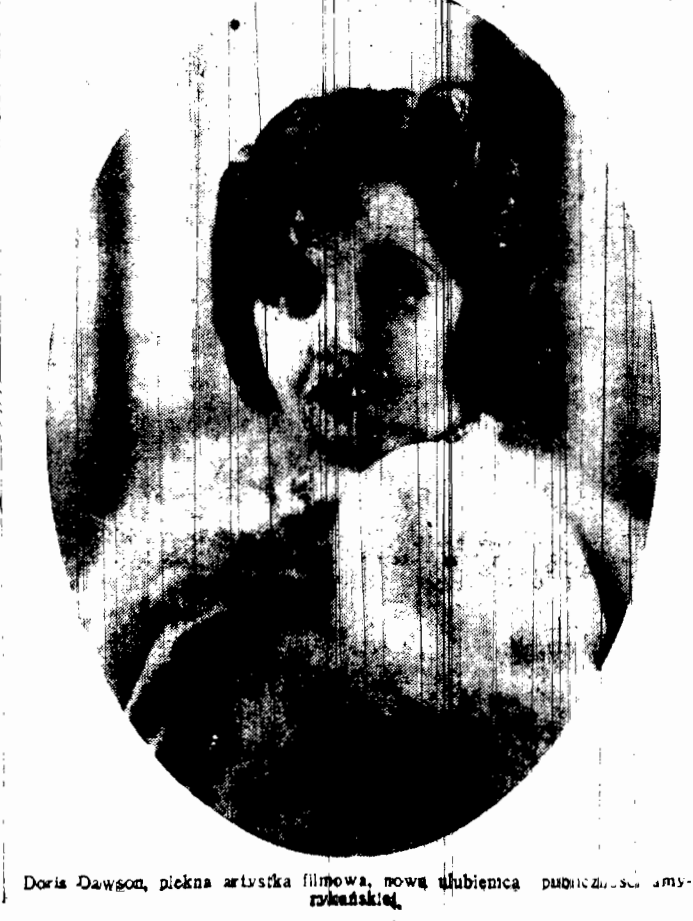
Doris Dawson, piękna artystka filmowa, nowa ulubienica publiczności amerykańskiej.