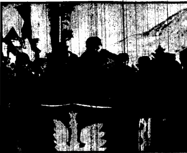
Wysoki protektor mistrzostw zakopiańskich siedzi z zainteresowaniem z trybuny reprezentacyjnej przebieg zawodów.