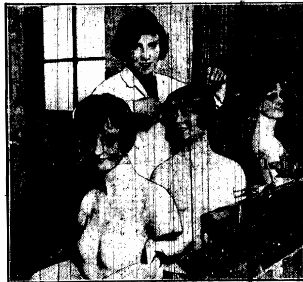
Fabryka fryzjerskich modeli woskowych, które zarówno uroda jak i cierpliwość mogłyby z powodzeniem konkurować z temi, których beda służyły za wzór.