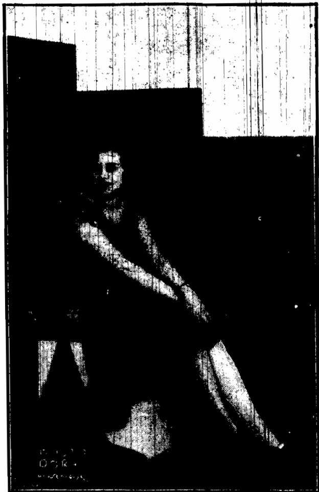
śle Wam jeden ze swych najwdzięczniejszych uśmiechów