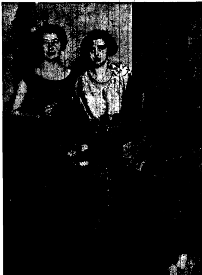
Po triumfalnym, wczorajszym, pełnym olbrzymich, żywiołowych owacji na jej cześć, opuszcza ukwieconą łożę reprezentacyjną w towarzystwie opiekunki p. dyr. Huzarskiej.