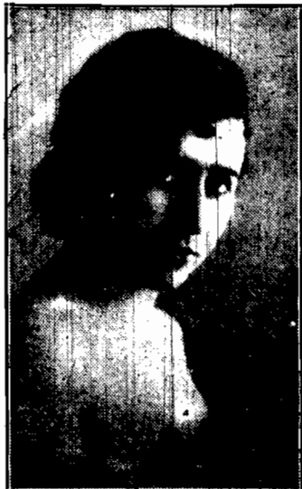
Tekla bar. Wołyńska (Wilno)