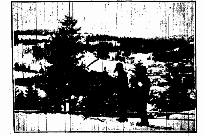
Kryzka w szacie śnieżnej wygląda uroczym, a dla narciarzy bardzo obciążającym.