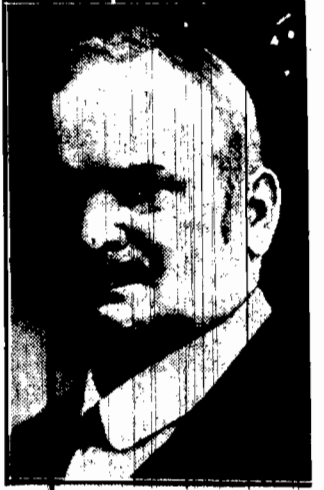
nowy prezydent parlamentu rumuńskiego.