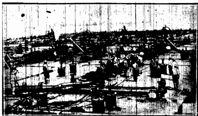
Niezwykły widok utękiego zbiornika benzynowego na Amazonce, zaopatrującego statki motorowe w materiał pędny