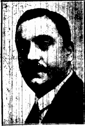
Wybrany przez akłamacie na prezyden- ta senatu rumuńskiego.