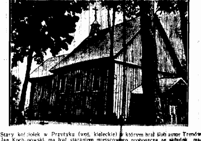
Stary kościółek w Przytyku (woj. kielecki) w którym brał ślub autor Tremów Jan Kochanowski, ma być staraniem miejscowego proboszcza z sędziak publicznych odnowiony.