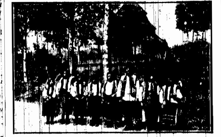
Huculi z Karpat wschodnich w malowniczych strojach... W piątek od wczesnego ranka...