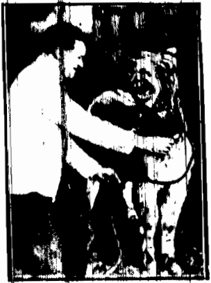
Staniszek... istotnym... Londynie...