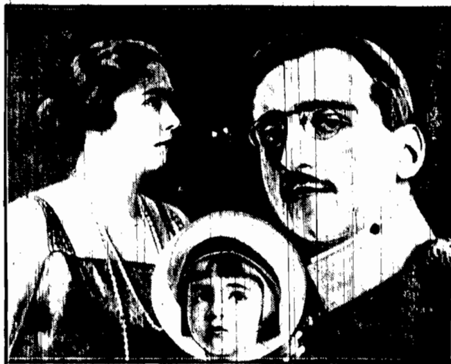
Jugosłowiańska para królewska, król Aleksander I...