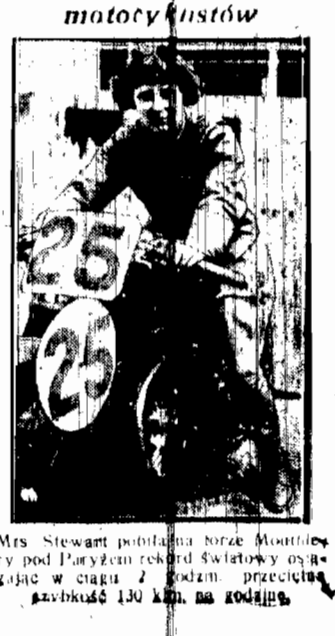
Groźna konkurentka motocyklistów