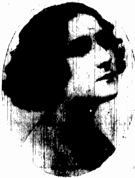
Taida hr. Wodzicka

V. Swoja fotografie (wylazona są bezwzględnie zdjęta w kostiumach kąpielowych, trykotach i t. p.).