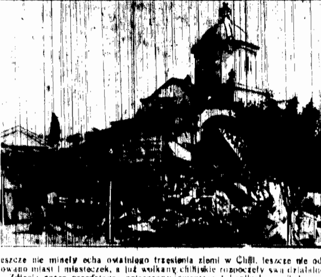
Jeszcze nie minęły echa owalnego trzęsienia ziemi w Chili, jeszcze nie od-dawano miast i miasteczek, a już wulkan chilijskie rozpoczęły swą działalność.