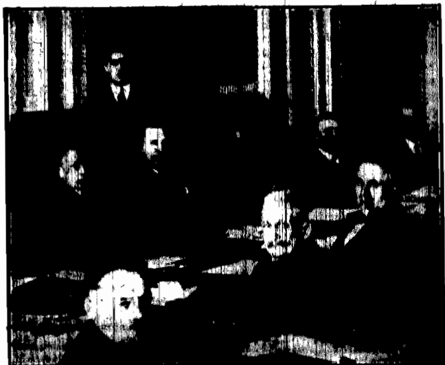
Zjazd rozpoczął się w dniu otwartym pod przewodnictwem min. Caha w Warszawie