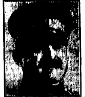
premier nowego gabinetu general Pera Złiwkiewicza.