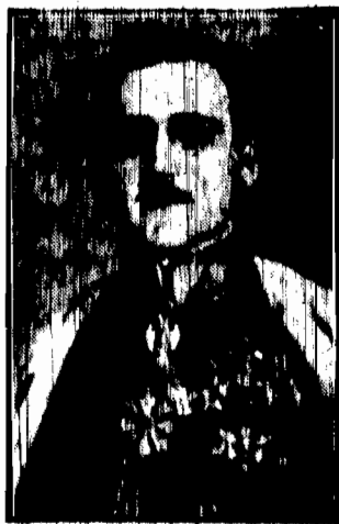
Aleksander, król Jugosławii