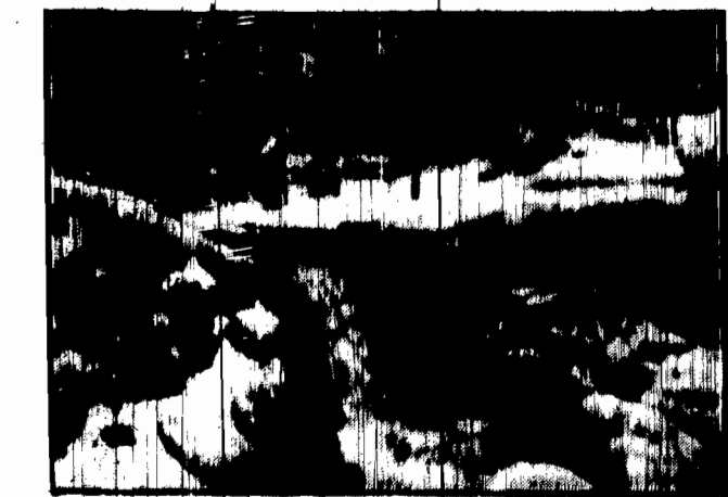
Widok na Bystercę.