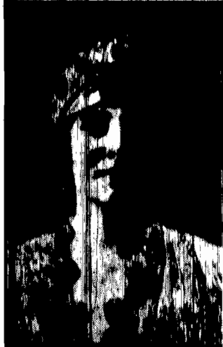
Królowa Maria Jugosłowiańska