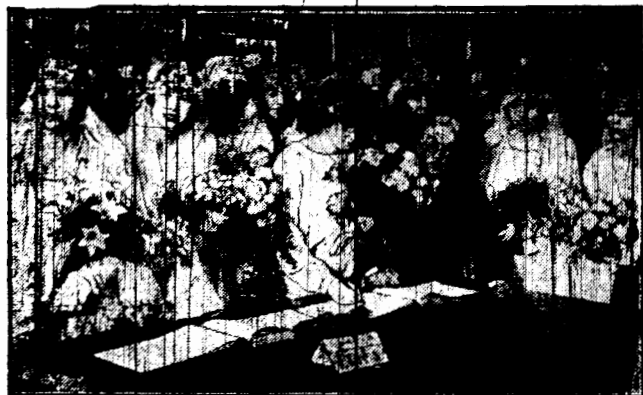
Szczęśliwe parę, którym dane było w najszczęśliwszym dniu roku — w Wigilię, połączyć się na wieki z ukochanymi w zakrytej kościoła św. Jerzego w Londynie.