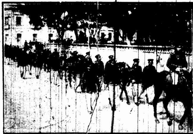
Zmobilizowany oddział karabinów maszynowych maszeruje przez Asuncion — stolicę Boliwji.