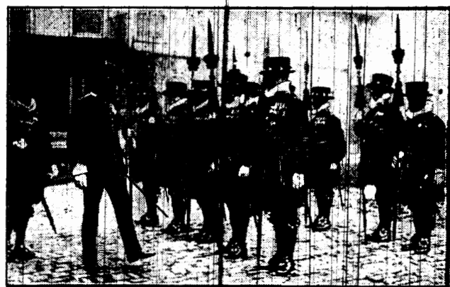
Dorocznym zwycięzcom na dziedzińcu Tower w Londynie odbył się przegląd „Yeomanów” gwardji, których tradycja sięga XII wieku. Oddział ów wystąpił we wspaniałych strojach ze złota i purpury.