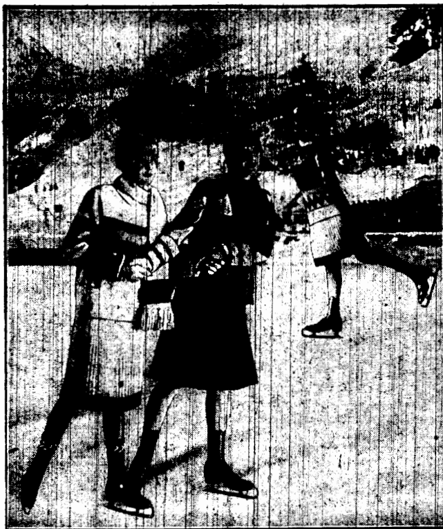
Najmilsze zimowe chwile na ślizgawce dają pole do popisu prawdziwej elegancji. Rozmaite kostiumy trykotowych i wełnianych, barwne czapeczki i szalik, rozwiane na wietrze, stanowią przemiły obraz dla oka.