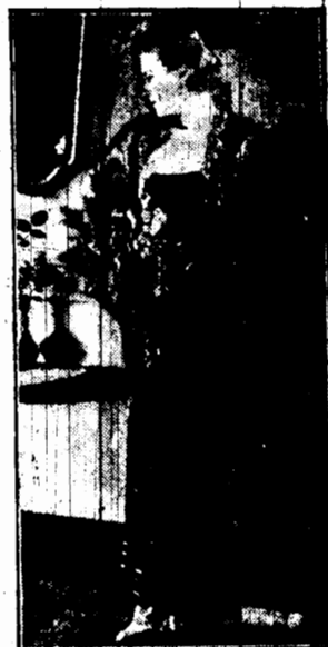
Artystka Baklanowa, gwiazda filmu amerykańskiego z zadrodzima datrzy na róże, która jedynie może konkurować z jej pięknoscią.