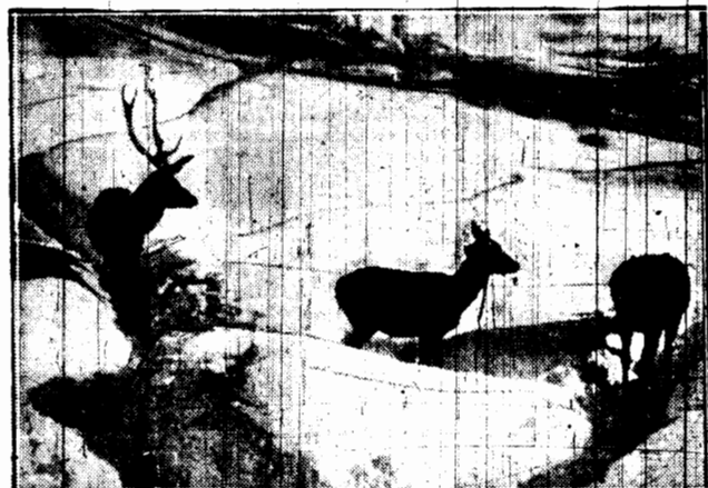
Jeden z szary nie widza piękności zasneżonych pol gorskich. Widza jedynie, że twarzą zmarzniętą skorupa zamknięta im wszelki dostęp do żdźbła trawy, że czeka ich może śmierć głodowa.