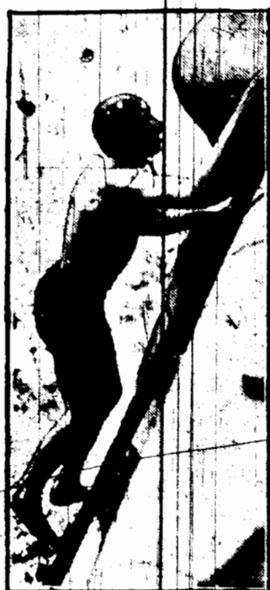
Dziś w wyścigach w pierwszy dzień świąt zorganizowano w Paryżu wyścig „pływacz przez Bekwane” Mimo 8 stopniowego mrozu na starcie stanęło 23 pływaków. Zwyciężył Szwajcar Zwahlen, którego widzimy na zdjęciu.

Kruszon... poncz... cocktail... szampań I „wzmocniona z kropelkami”