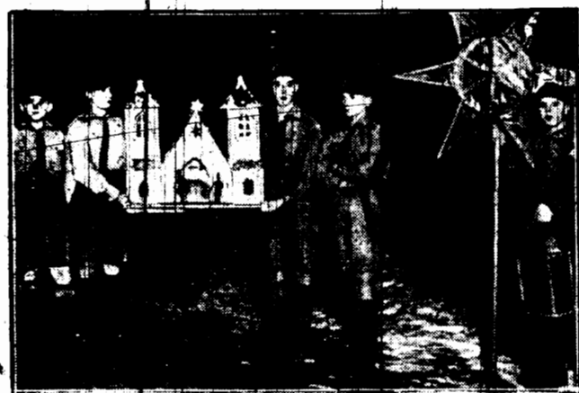
Drużyna harcerska mająca kwatery w szkole w Warszawie wyruszyła z szonką na polską ośledla mieszkaniową. Wesołe przysięgi i kolędy dzielnymi harcerzami budziły wszędzie żywe zainteresowanie. Szonka jest dziełem ręk harcerskich.