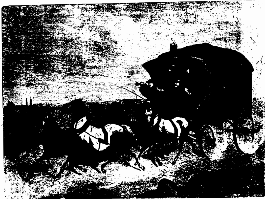
Rys. 8: Kurierek pocztowa.