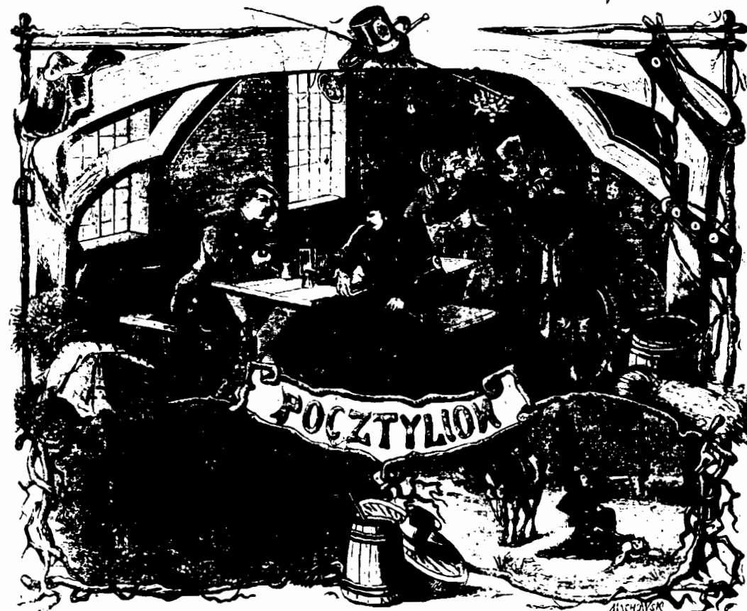
Rys. 9: Ilustracja do wiersza W. Syrokomli „Pocztylion”. Drzeworyt Machowskiego, rys. Dmochowskiego („Kłosy”).

Przechodząc z kolei do opisywania sygnałów oraz melodji, wygrywanych na trąbce pocztowej, należy nadmienić, iż w zbiorach histo-