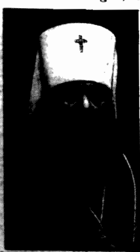
Metropolita Dyonizy, głowa autokatolickiego kościoła prawosławnego w Polsce, w drodze do pielgrzymki do Rzymu.