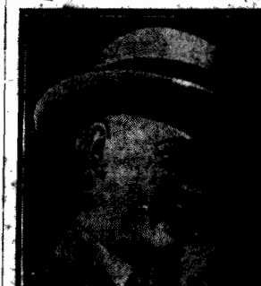
Następca tronu angielskiego kr. Walii bawi obecnie w Madrycie, jako gość króla hiszpańskiego.