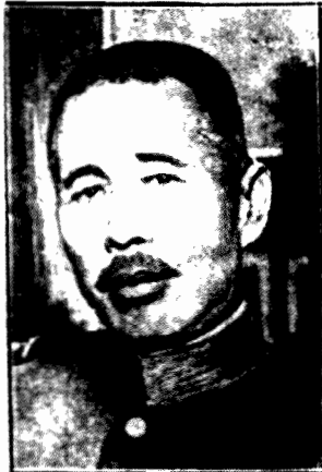
GENERAL TANOKA, były przewodniczący stronnictwa „Selynkai” znawcą energicznej polityki w stosunku do Chin oraz zblżenia anglo-japońskiego