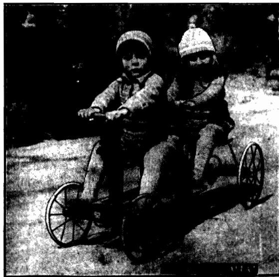
Pomimo chłodu parki i skwery w każdy dzień pogodny roją się od dziatwy. Na zdjęciu — para najmłodszych sportsmenów, uprawiająca pod „czujnym” okiem matki i jej brata” jazdę na swojego rodzaju tandemie.