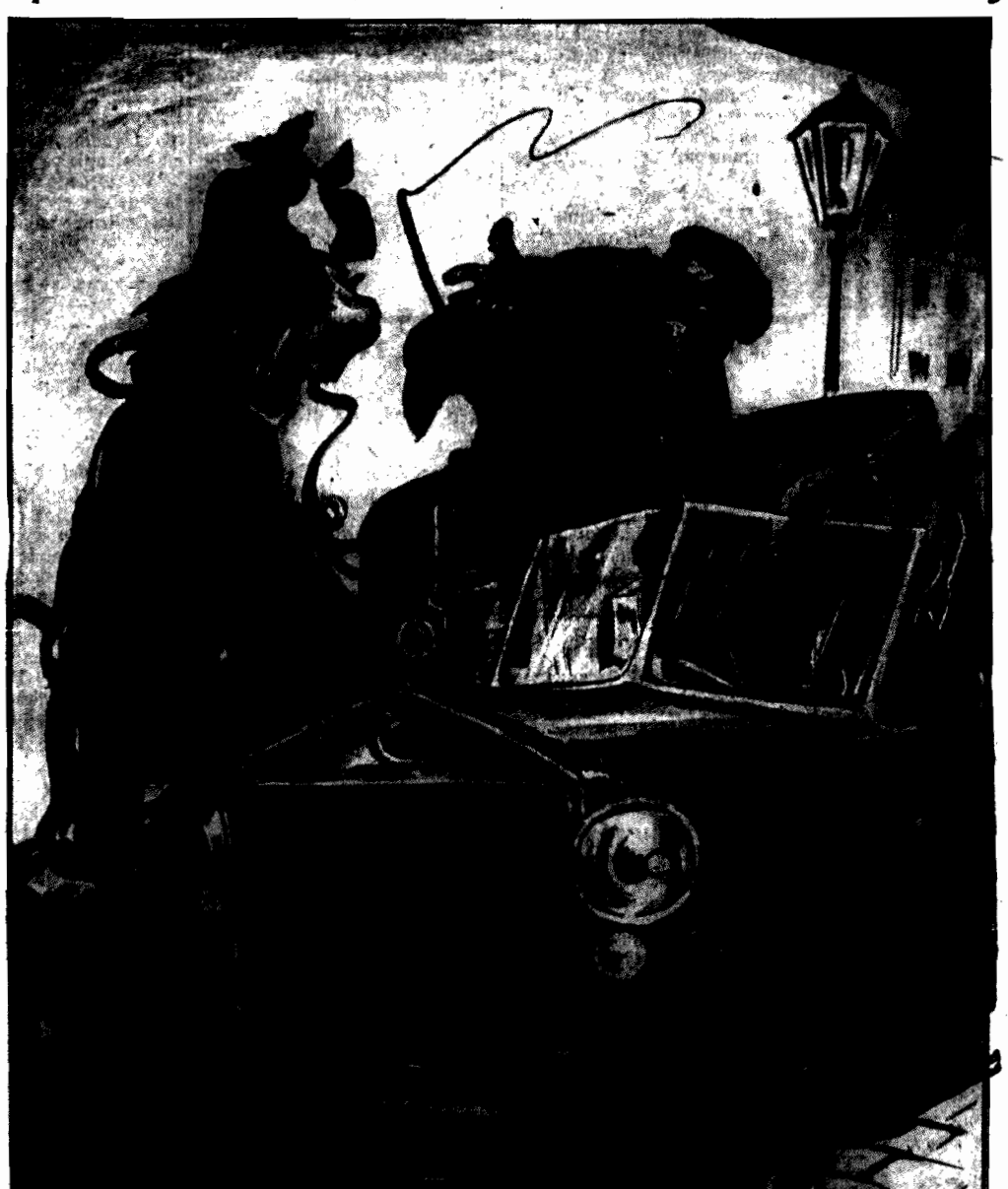
czyli „Dzied z Brytanem na klasnej ulicy”.