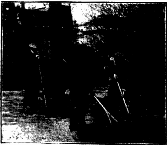
W parkach i ogrodach roboty ziemne już są w pełni.