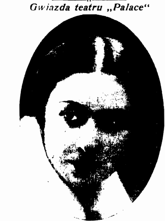
Słynna amerykańska tancerka zbiera obecnie laury w teatrze „Palace“ w Paryżu.