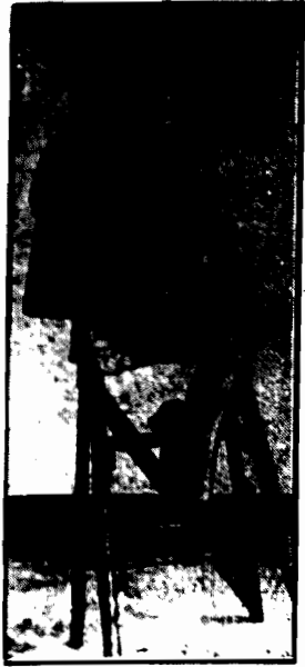
...am pomysłu jednego z amerykańskich reżyserów filmowych.

Każdy talent, który się zjawia, należy pielegnować, a nie niszczyć go w obawie przed konkurencją.