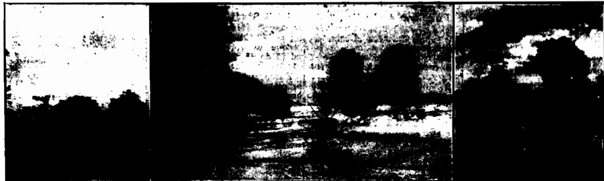
Zdjęcie zimowe i letnie rzeki Lan na Polesiu. W płasku, zacerpniętym z jej dna, znalazłono, jak wiadomo, srebro i złoto. Te same metale szlachetne wykryto również w ziemi, wziętej z terenów nadbrzeżnych.