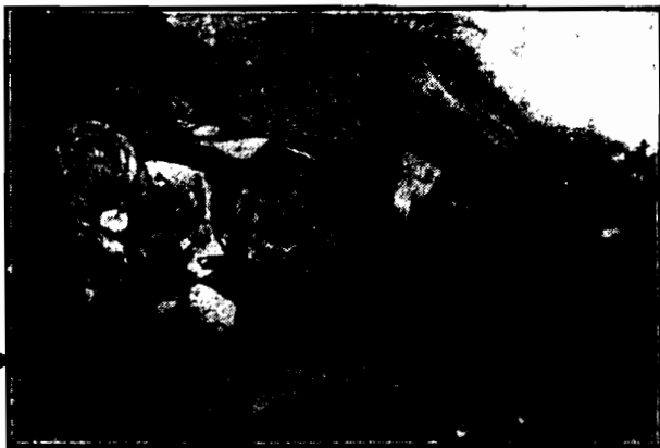
W Monroe w Ameryce wskutek zderzenia dwu samochodów postradało życie kilka osób.