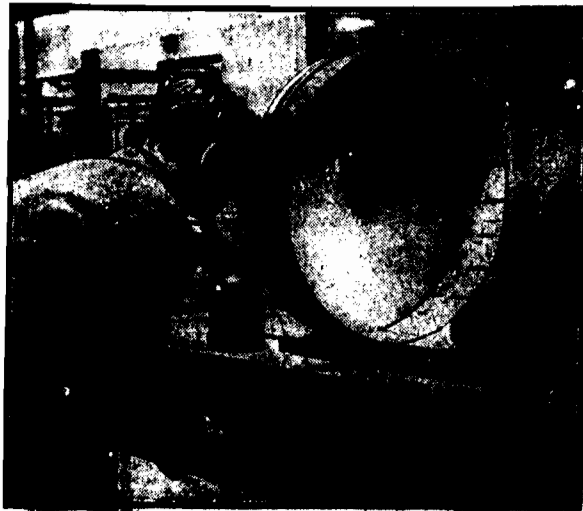
DO OBRAZU: „KON W SKOKU”.