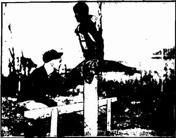
Instruktor futbolu uniwersytetu w Evangton U. S. R. ćwiczy swoich uczniów w skokach tak potrzebnych przy futbolu.