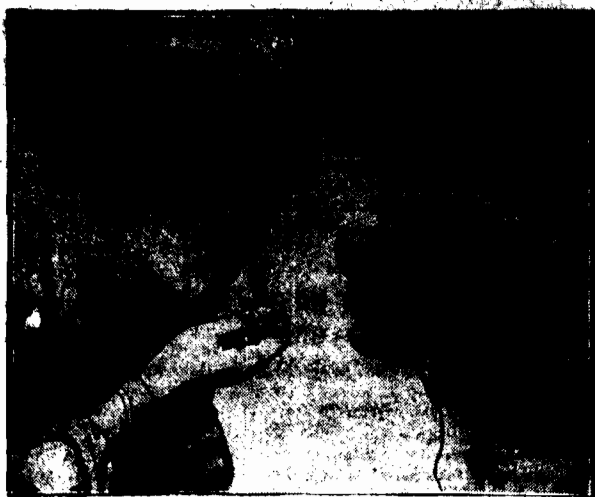
P. Paulina Starke, słynna gwiazda filmowa wraz z swym psem „Jiggsiem”, który trzyma w zębach lusterko, służąc swej pani jako żywa toaletka.