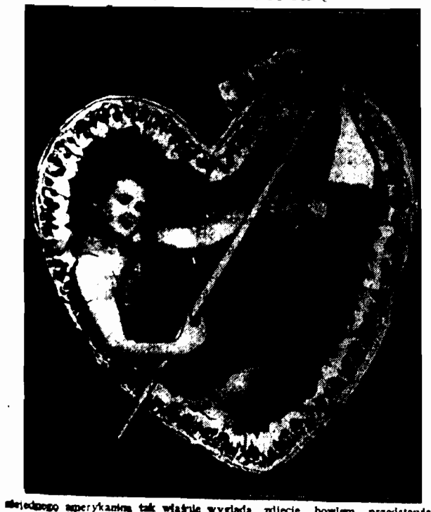
Wielkiego amerykańskiego tak właśnie wygląda, zdjęcie bowiem przedsięwzięcia...