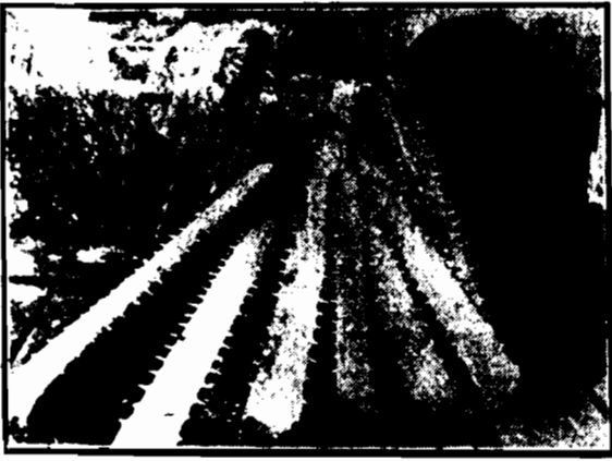
Wielka szereg ryb-jeń, poławianych często na wodach Floridy