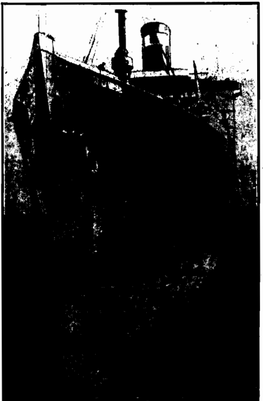
'Londystan' w czasie odnawiania się w dokach londyńskich.