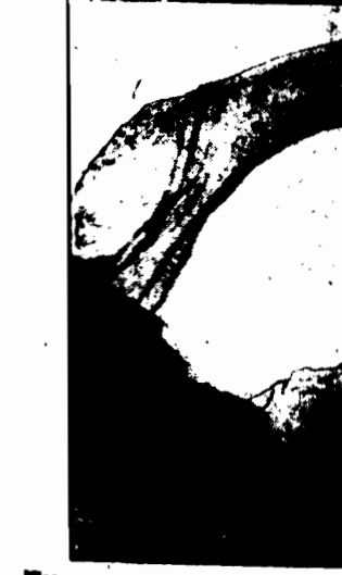
Niewzruszony most w stanie Arizona w Ameryce, przypominający olbrzymi kaktus.