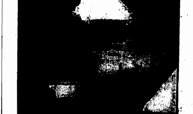
Dziwy parku narodowego w stanie Arizona, Ameryki Północnej.