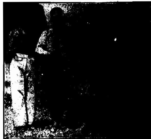
Najnowsza kostiumy ka pielona na rok 1927-28