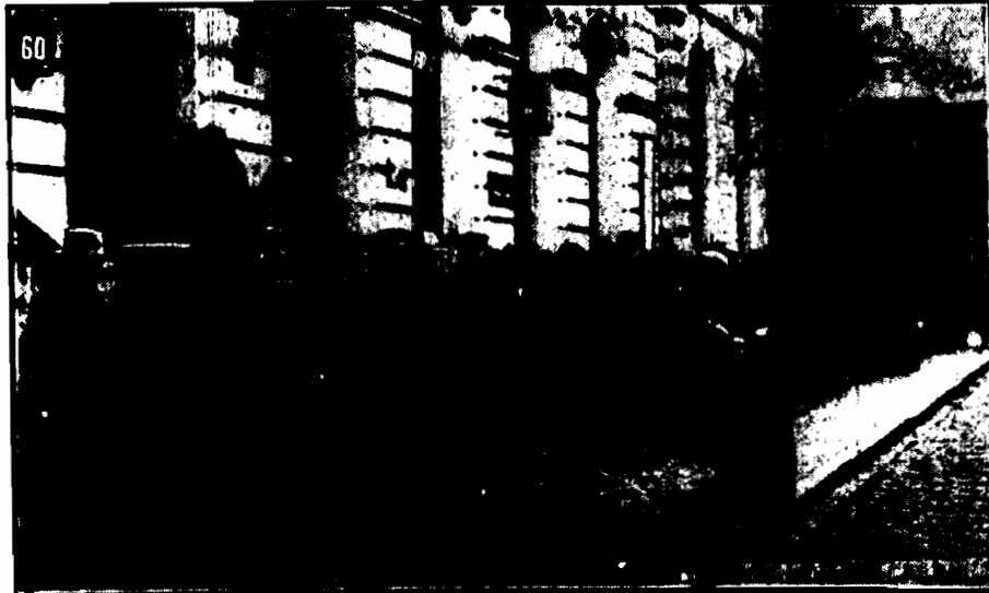
Na Krakowskim Przedmieściu, z tyłu poza pomnikiem Mickiewicza codziennie gromadzi się tłum bezrobotnych, oczekujących przed wydziałem opieki społecznej na wypłatę zapomóg