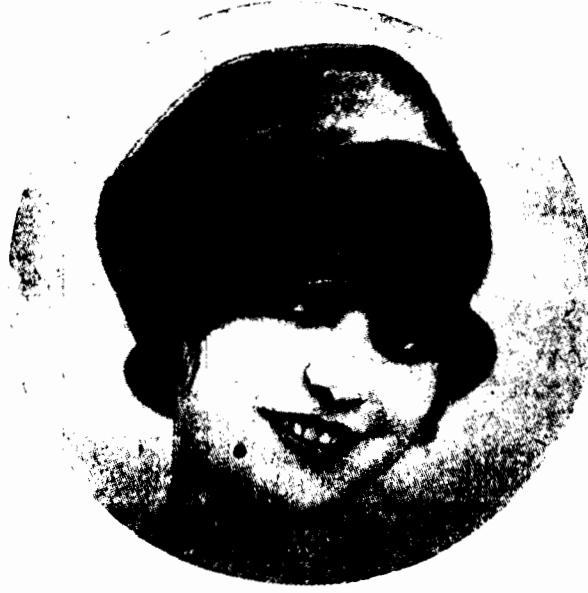
Najmodniejsze przybranie głowy z drogiej kamieni do toalet wieczornych