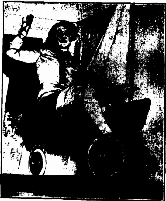
Nowa amerykańska zabawka: rodzaj samochodu dla dzieci, poruszany siłą wiatru.