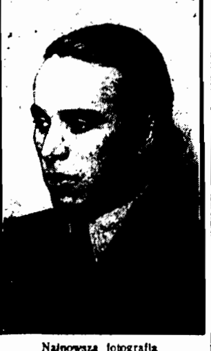
Najnowsza fotografia (Zdjęcie dokonane w sadzie w czasie procesu rozwodowego).

CZYTAJ CIE „Cyrulika Warszawskiego” Cena 50 gr.