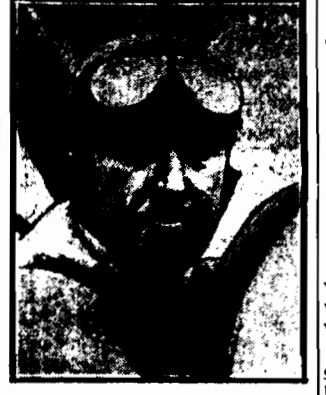
Anglik Parry Thomas, zginął podczas wysięgu automobilowego, ustalając podobie rekord światowy szybkości.