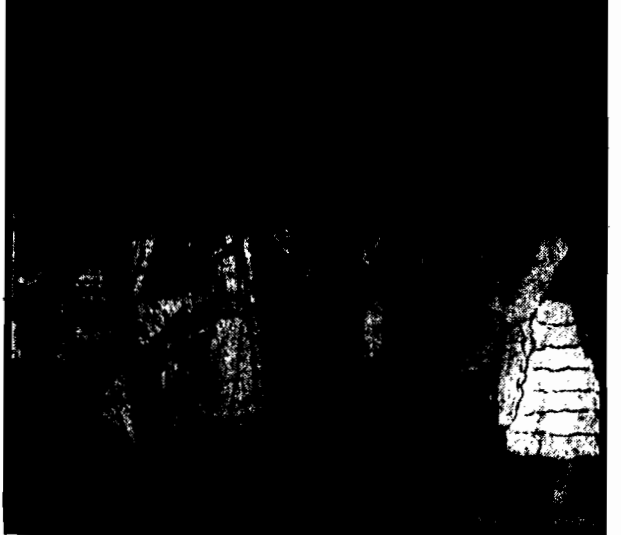
Niekiedy przestępcy odegrali tu rozweśloni ciężkich chwil więziennych obrazek sceniczny „Kto im żyj powrócił”

W czasie siedmioletniej wojny zapano w Górnej Austrii ludożercę w chwili, gdy ogrywał kochankę zamordowanej przez siebie dziewczyny.