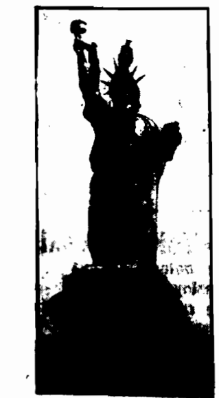
Ożyczyli posąg Wolności w Nowym Berlinie bywa co pewien czas poddawany generalnemu szorowaniu. Głównym mycia zamorusanej wolności przedstawia zdjęcie nasze.

Min. Kwiatkowski podkreślił, iż należy zwrócić uwagę na rozwój eksportu, który systematycznie się rozrasta.