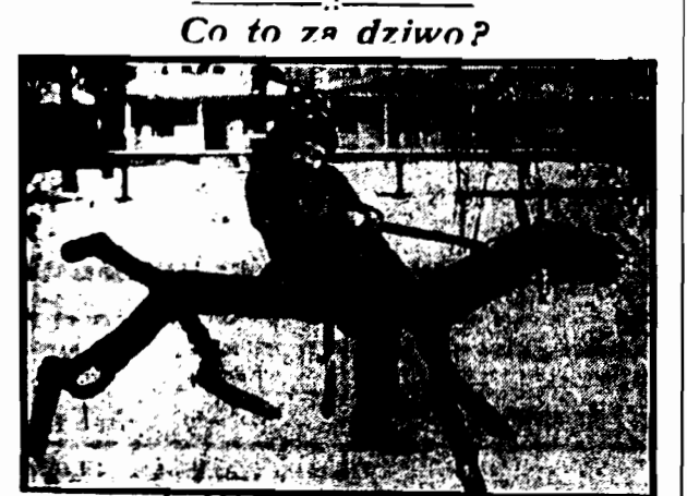
Z pnia i rozgałęzi drzewa widać widać postać i dźwięki, a zarysach...

za wykrzykwanie alarmujących słów wojenne S.S.S.R." MOSKWA 24.2. Mimo interwencji ambasady amerykańskiej, nie wypuszczono z więzienia 100 kolporterów gazetowych, którzy przy sprzedaży czytelnikom „Moskwa wieczorem” wykrzykiwali „Przygotowania