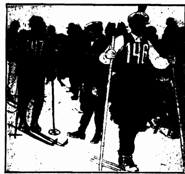
NA STARCIE BIEGU 15-KILOMETROWEGO Wyruszenie na zawody