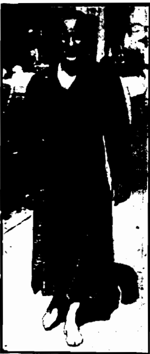
Własność w skórę, który w czasie zimowania w skórę, znów...