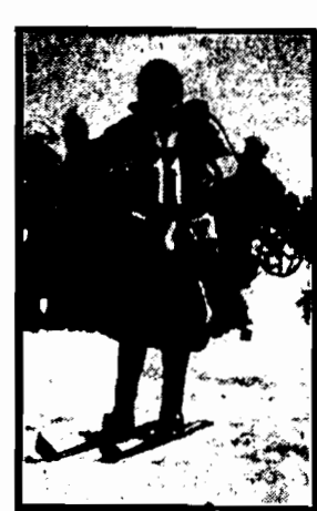
W biegu 8 km. o tytuł mistrzyni Polski