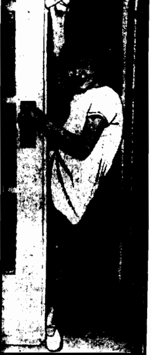
Najmłodsza wychowanka teatru Holson w New Jorku przy porannych ćwiczeniach.

miljonowej wartości wystawiono na licytację Wśród licznych skarbow, należących do rodziny carskiej, osobny dział stanowią zabawki dziecięce, przedstawiające wartość setek tysięcy dolarów. Rząd sowiecki wystawił je na licytację. Najmilszą zabawką cara Mikołaja II-go była miniaturowa kolej złożona z ośmiu wagonów i parowozu, sporządzona ze złota i platyny. Aleksander III-ci cieszył się niepomiernie, gdy mu ofiarowano jako dziecku, drzewo pomarańczowe, zrobione ze złota, szmaragdów i rubinów. Wśród zbiorów zabawek znajduje się miniaturowy powóz sporządzony z platyny, latarnie zaś powozu zrobione są z dwudziestokaratowych brylantów. Arcydziełem swego rodzaju jest szpilką, zakończona zegarkiem nie większym od owocu wiśni. Aleksander II-gi zbierał psianki wielkanocne. Miały one wygląd jaj lecz zrobione były z drogich metali i masy perkowej wysadzanej bogato szlachetnymi kamieniami.