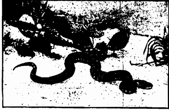
Czarna cobra dosięga czasami 9 stóp długości. Gad ten jest mniej jadowity od innych gatunków coby.