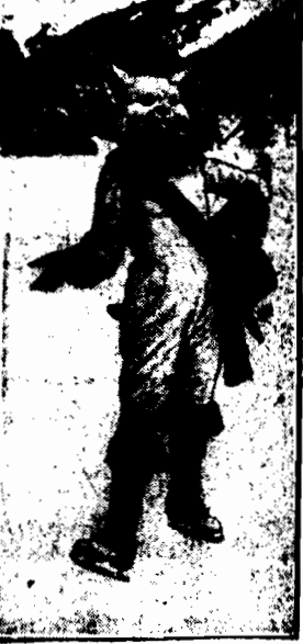
Podczas balu maskaradowego na dziedzię w St. Moritz