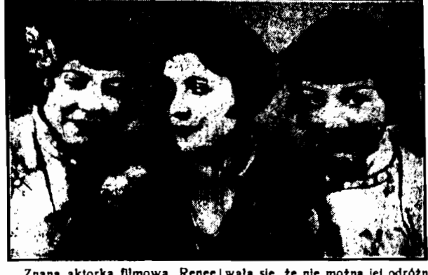
Znana aktorka filmowa, Renee Adoree, mając grać Chinkę w filmie, tak doskonale ucharakteryzowała się, że nie można jej odróżnić od prawdziwej Chinki, która widzi imię na zdjęciu na prawo.