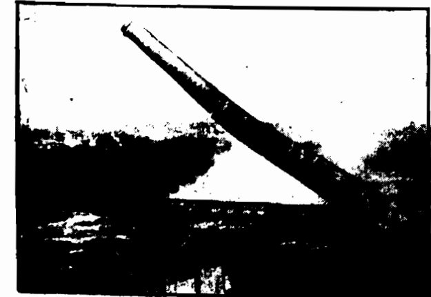
60 metrowy konik fabryczny sfotografowany po wysadzeniu dynamitem.