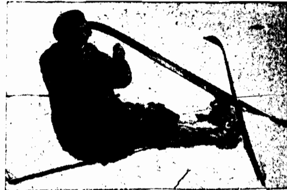
Po upadku na nartach, elegantka chwytą w pierwszym odruchu za puderniczkę.