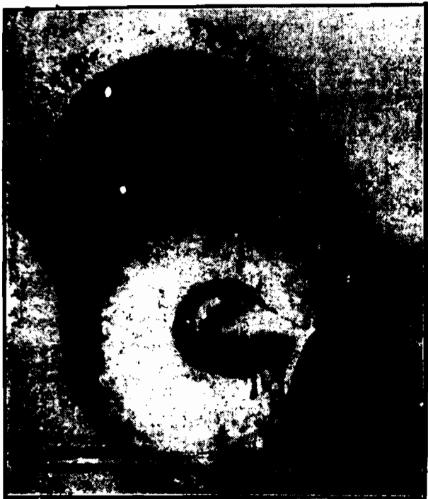
Patrz strona 2-ga.