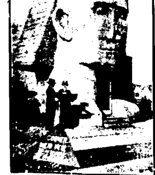
W Los Angeles w kształcie slanksa.

Opłaki tej nie podzielały jej uczennice 14- i 15-letnie dziewczęta i pewnego dnia zjawily się w klasie z fryzurami chłopięcimi.