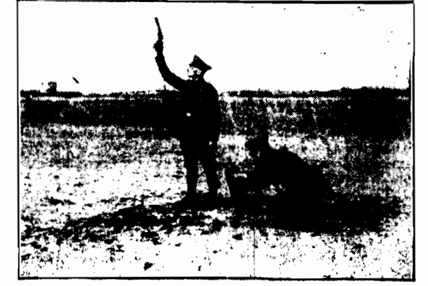
W Niemczech specjalna policja wskazuje sygnałami świetlnymi drogę samolotom, kursującym pomiędzy poszczególnymi miastami.