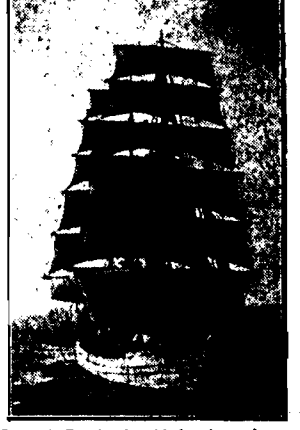
Opodal Portlandu, blisko brzegów an- gelskich francuska barka natknęła się na parowiec, przyczem 24 marynarzy znalazło śmierć w wodach morackich