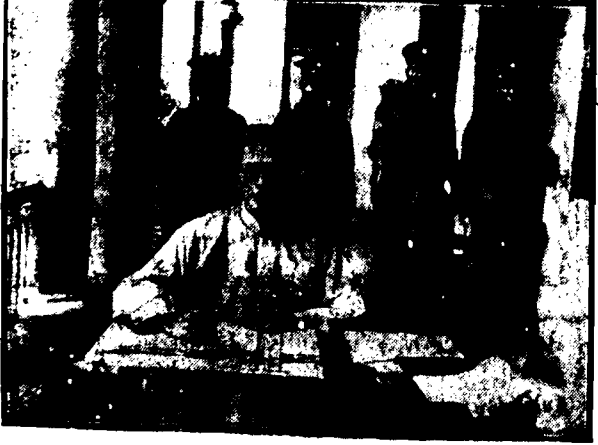
KOMISARZ W. V. SOONG, który zabiega o utrzymanie trybu życia w Chinach