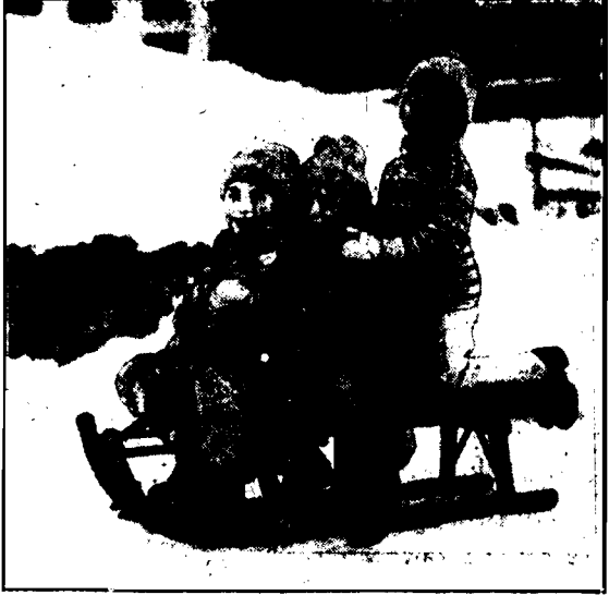
Trzej młodzi saneczkarze marzą o karierze Krzeptowskiego i Kasia, mistrzów sportów zimowych.