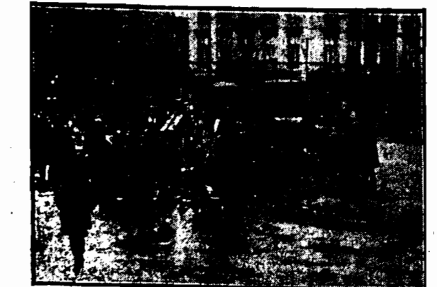
Przedjadrę szosu Złotnicka uległa onegdaj poważnemu uszkodzeniu magistralna linia wodociągowa. Naprawa spowodowała ograniczenie ruchu kolejowego i zmianę rozkładu jazdy kramajów.